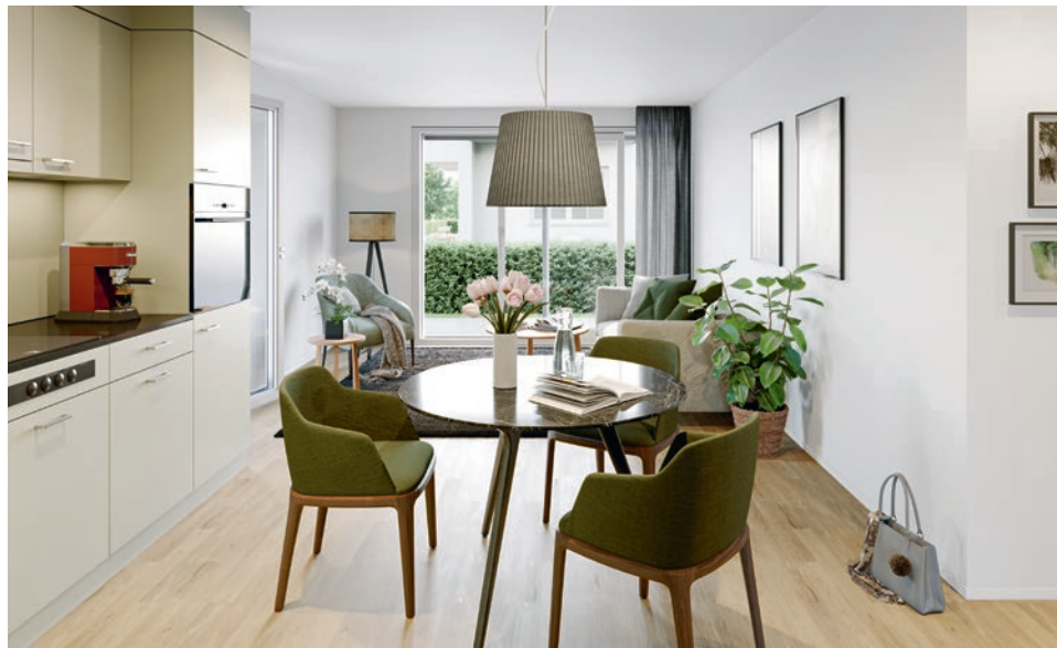
Blick in eine 2½-Zimmer-Wohnung