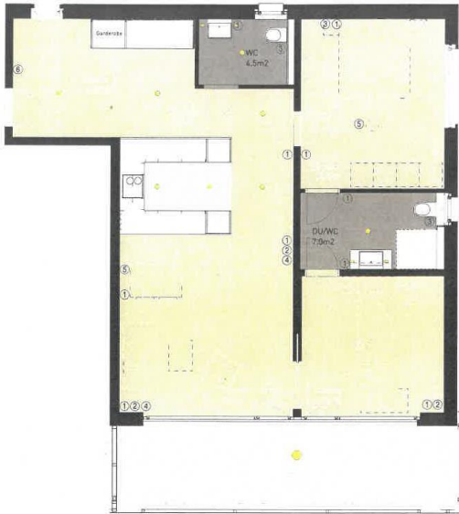
Wohnung A1.01 / 3.5-Zimmer-Appartement