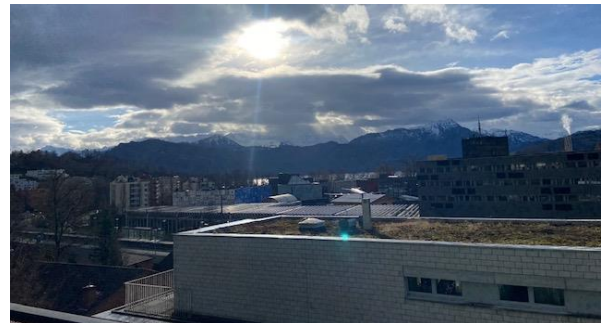
Bilder: Wohnbeispiel Muster Appartement, Aussicht Appartement A1.01