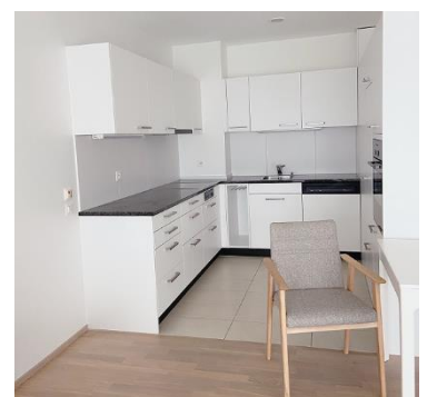
Bilder: Wohnbeispiel 2.5-Zimmer-Appartement, Aussicht Appartement A2.07