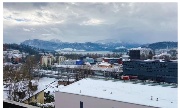
Bilder: Wohnbeispiel 2.5-Zimmer-Appartement, Aussicht Appartement A4.02