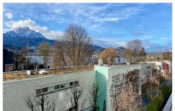
Bilder: Wohnbeispiel 2.5-Zimmer-Appartement, Aussicht Appartement C2.02