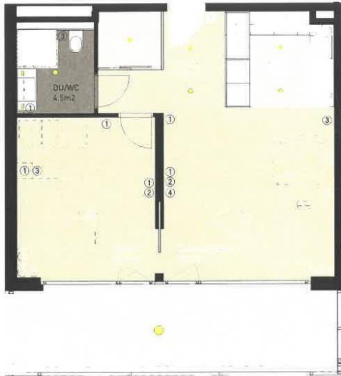
Wohnung C2.02 / 2.5-Zimmer-Appartement