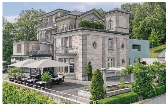
Fotos: Wohnbeispiel 2.5-Zimmer-Appartement, Aussicht Appartement C2.03